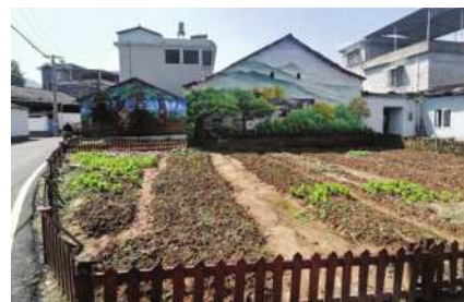
图3 写实风景类型的墙绘艺术