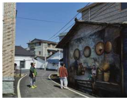
图4 农耕文化类型的墙绘艺术