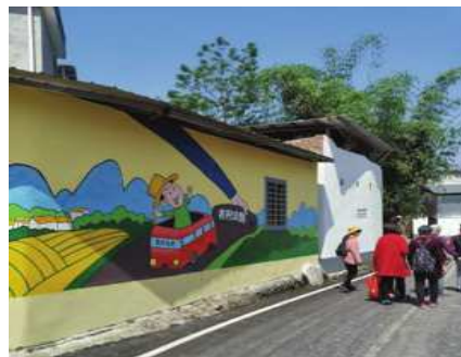
图5 卡通形象类型的墙绘艺术