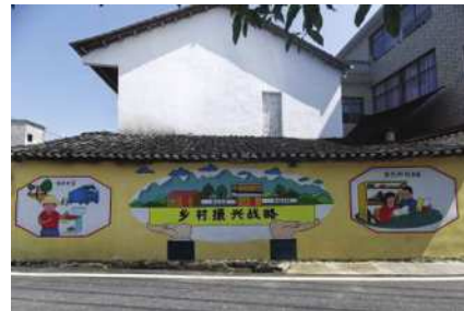
图2 形势政策类型的墙绘艺术