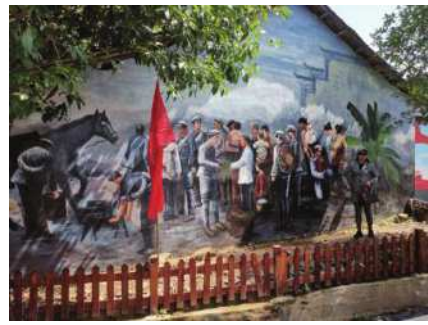
图1 红色文化类型的墙绘艺术

对甘草村进行墙绘的设计团队结合当地的风俗习惯、产业结构、村民的文化素质和政府的要求等信息进行创作。在创作过程中，因地制宜，根据不同的房屋造型及周边环境，将实景融入到墙绘中，让画面更生动和谐，也会通过墙绘的受众人群来确定主题，如在小孩子走动较多的道路绘制卡通形象等等。