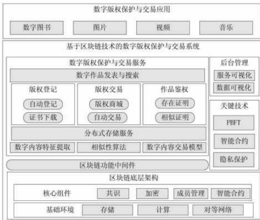
图1 系统总体功能图

基于区块链的数字版权保护能够方便、安全、廉价地完成数字内容著作权的登记、验证、认证和交易，全面建立以著作权人为中心的保护和交易机制，提供全流程服务。该系统主要包括五个功能模块：数字宣纸刺绣发布、版权登记、版权交易、宣纸刺绣认证和后台管理。技术架构采用 BCOS 平台和 PBFT 共识机制的联盟链实现。见图 1。