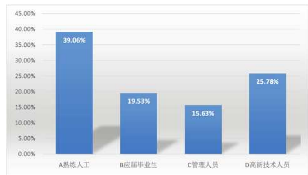
图2 湛江市中小微企业急需人才的分布情况

我们对湛江市中小微企业急需的人才进行了问卷数据调研,从图2可知,大部分企业对于熟练人工和高新