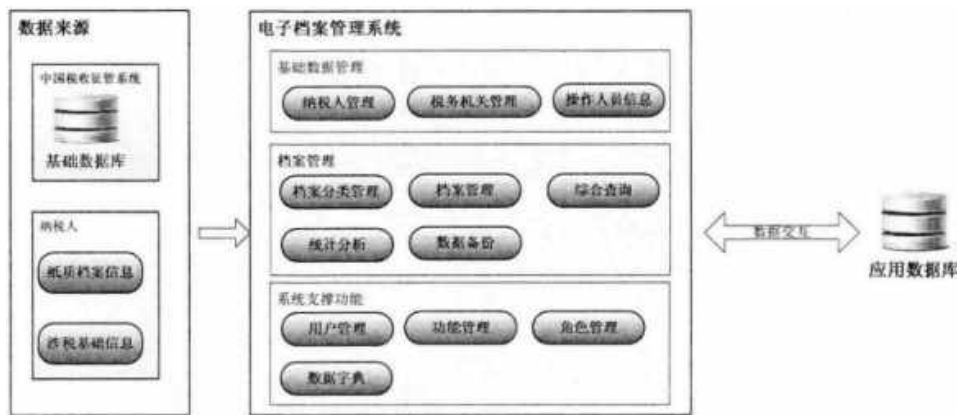
图2 电子档案管理系统建设框架图

第二，利用已完成的数字化档案目录和全文资源，编制计算机检索工具，提高档案信息的查全率和查准率，简化群众利用的步骤，并且进一步争取构建各个乡镇间档案信息资源互通网络，实现群众利用乡镇档案资源的最快捷化 [5] 。