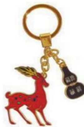
图1 九色鹿新型钥匙扣

根据该民俗相关的起源、传说以及发展过程等要素,就可以完成其深层次文化内涵的挖掘,然后结合其真实含义设计制造出符合特定文化特征的冰雪文化创意产品,而与过往直接根据习俗设计产品不同 [4] 。比如,敦煌设计研究机构曾经设计研发了一款新型的钥匙扣(如图1),以九色鹿作为主题,取材于《鹿王本生》的壁画作品,通过对该作品中故事内容以及角色形象的具体研究和仔细分析,了解到九色鹿代表着智慧勇敢与善良,它能够凭借这些美好的品质逢凶化吉,将其作为主题形象意喻祝愿人们的平安顺遂,同时在钥匙扣当中嵌入葫芦,与“福鹿”相谐,表达对佩戴者的美好祝福,更重要的是有效传播与弘扬了当地文化。