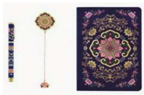
图3 北京故宫博物馆文具套装

例如,北京故宫博物馆根据馆内收藏的文物作品“画珐琅缠枝莲纹方盒”(如图3),研制出了与传统不同的文具套装,在这组套装当中,钢笔是用合金材质与印刷工艺制造,虽然造型相对简单,但配以绚丽的底色,便形成夺目的金属光泽,充分地展现出了珐琅的质感,而书签则是使用黄铜的材质再加上蚀刻电镀工艺,整体线条流畅,带有别具一格的华美和亮丽之感,文具套装的底色都是深邃蓝,并且刻有细致的雕花纹路,既展现出了复古的宫廷气息,又充分地表达出了文物特有的繁复之美 [7] 。