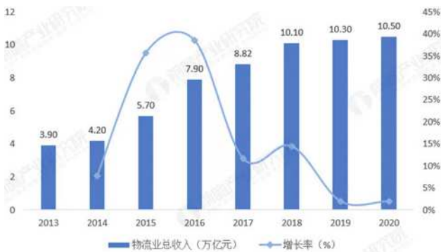
图1 2013-2020年中国社会物流业总收入情况趋势图 二、大数据视域下的物流管理存在的问题

近年来，我国的物流业发展势头很好。虽然2020年的整体宏观经济面临着严峻的考验，然而，物流作为国民经济的主力，却始终克服重重困难，坚持以高质量发展的理念，实现了全年的持续稳定增长，规模递增，收入稳定提高，为整个国家的经济发展提供强大的支撑力量。2020年，物流行业实现了10.5兆元的收入，较上年同期增长2.2%。从第三季度开始，物流行业的整体增长速度从负向正，从四季度开始，物流行业的整体增长速度开始加快，并逐步恢复到去年的水平。中国社会物流成本在2015-2020年度呈逐年递增趋势。2020年，社会物流成本达到14.9兆元，较上年同期增加2.0%。社会物流成本占GDP比重为14.7%，与2019年相比基本保持不变（如图1所示）。从这一点可以看出，过去五年来，我国的物流发展总体上看是比较好的，不管是收入，还是成本，都有增长的趋势，整体上都在依靠物流 [1] 。