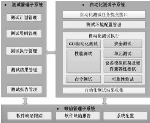
图1 自动化测试平台体系结构

测试，由故障管理等子系统组成。如图1所示，该结构包括规范测试要求、制定测试计划、编写测试脚本和设计测试脚本、获取测试结果、生成测试评估报告、改进软件缺陷并监管其他流程。