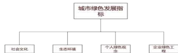
图2-1 绿色发展指标评价体系

本届大运会本着“绿色、智慧、活力、共享”的成都理念,以赛事为契机,坚持以“谋赛就是谋城,营城就是惠民”为目标,主要从社会文化、生态环境、个人绿色观念与企业绿色工程四个方面解释绿色发展的指标。