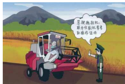
图2 农业机械安全生产宣传

很多农业机械操作人员在落实现场作业时没有严格要求自己, 在其掌握了一定程度的安全生产知识的情况下, 无法将专业的知识内容与实践操作相结合。农业企业在发展经济的过程中, 要加大安全生产宣传力度, 尤其是行政管理部门要定期开展宣传培训工作, 将农业机械操作人员组织起来, 使其可以参加安全宣传座谈会, 掌握农业机械的使用要求, 提高实践操作的规范性。在落实宣传工作时, 管理人员可以讲解农业机械使用过程中的注意事项, 列出规范化操作流程, 加强操作人员的