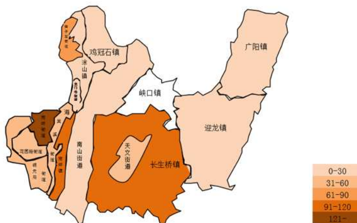
图3 2011~2022年南岸区百日咳发病镇街分布图