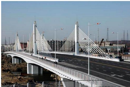
图2 桥梁与道路建设施工现场照片

是否可以满足建筑环境的要求。道路和桥梁的建设涉及了许多的技术方面,施工要求也变得很严格,并且技术管理需要专业知识。然而,实际上,建筑材料的类型非常复杂,并且材料容易干扰施工现场,通常施工过程中还会出现滥用材料的现象。