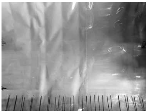
图 1 为公路桥梁隧道建设中止水板挂设

该工程项目建设中所使用的防水卷材质量很大程度上会对防水层的最终施工质量造成影响，所以需要运用符合设计以及建设标准的卷材，确保该材料整体的厚度处于一致。对防水卷材进行铺设期间，首先要在隧道的拱顶处记录好中心线，运用移动的台架开展卷材的铺设操作，该材料的铺设及拱顶中心线向两边不断扩散。在铺设期间需要维持该材料的平整性，以免发生膨胀以及折痕现象。