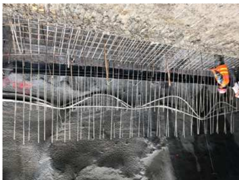
图4为现场中埋式橡胶止水带预埋安装