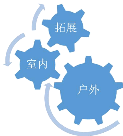
图2 幼儿园游戏类型结构图

基于童乐游戏课程的安排下，幼儿一日生活中的游戏主要是由户外游戏、室内游戏和拓展性游戏组成，每个游戏各施其能，共同促进幼儿身心和谐发展。