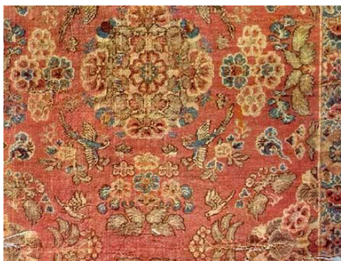
图 1.3 盛唐时期陵阳公样

进入盛唐时期社会全面发展，蜀锦生产机器有了重大更新，花楼束综提织机的出现提升了整体工艺水平。之前的锦织物都是以经线提花为表现，新的织机产生提供了纬线提花的锦织工艺品制作的途径。由于唐代对外开放的政策，文化交融的大背景下大量的西域文化流入我国，对于这个时期的锦织物纹样都有重要影响，这一纹样吸收了波斯萨珊王朝的联珠团窠纹样，在团窠内部有西方的动物纹比如孔雀、犀牛、狮子、骆驼等还有大量西域植物纹。整体的色彩亮丽，一度在上层人士中风靡。如图 1.3 是盛唐时期窦师纶设计的“陵阳公样”。同时这一时期流行联珠小花锦，纹样和织物组织都有大量的西域元素加入。