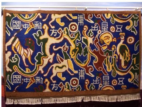
图 1.2 汉代蜀锦：五星出东方利中国

据《汉书·赵充国传》记载，这块蜀锦出现在如今的和田地区极可能是西汉王朝对于西羌的讨伐所留下的文物，而且此蜀锦有一定的迷信占卜功能，五星指的是天上五颗行星同时出现于东方的天空中呈现“五星连珠”的奇特天文现象，古人占卜这种现象有利于当时西汉军事局势胜利。这块蜀锦采用了黄色、白色、绿色、青色、赤色五色构成，这是秦汉时期植物染料所得，制作工艺进一步的复杂，是汉代锦织物的制作巅峰代表。