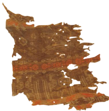
图 1.1 战国时期对龙对凤蜀锦

简单（图 1.1），一般采用平纹织锦表现，但是这个时期的蜀锦已经有色彩呈现，可见当时处于萌芽时期的蜀锦和同时代的其它产物比较已经有别样的特色表现。