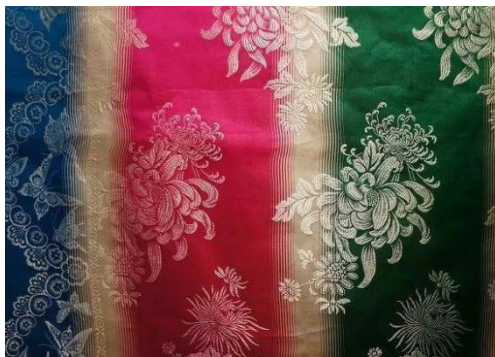
图 1.6 清代雨丝锦

径锦技术最好的体现；雨丝锦是径锦的另一种表现，色彩颜色有一种渐变的过渡，呈现一种光滑的雨丝顺滑感；可以说月华锦是雨丝锦的一个衍生，它又被世人称之为“月华三闪”，一般径向排列红色、黄色、绿色三色光晕，给人呈现不同于唐代华丽多彩的质朴感。