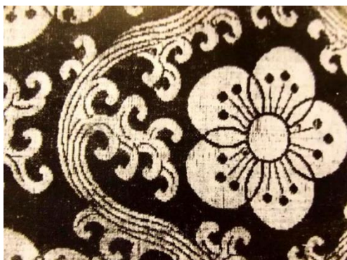
图 1.5 宋代落花流水锦

到了明清时期，由于政治中心南下，江南地区的制造厂开始兴起，蜀锦的地位开始逐渐下降，朝廷的官员用锦也变成了江南地区的锦织物，甚至在明末清初的战争中，蜀锦大多数的制造厂遭到破坏，产量也因为需求的减少而降低，整个蜀锦的发展进入一个低谷期。虽然身处低谷期，蜀锦依旧也有自己的特色存在，在清朝的时期也还是有几种特色锦织物生产，比如方方锦、雨丝锦、月华锦（图 2.6）的产生。方方锦顾名思义就是方方正正的锦织物，这种样式的锦织物是