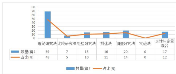
图2: 研究方法的使用数量及占比情况图

定性研究方法占据主导地位不仅体现在职业教育研究,在其他研究领域也占据着重要的地位,这与国家教育研究理论的发展进程息息相关,首先,用文字表达和证明是职业教育研究人员擅长和习惯使用的,他们通过对职业教育的现状和已有的职业教育的理论,来架构和完善职业教育理论体系,其次,定性研究主要侧重于职业教育之间的相互联系,以及发展的过程,在职业教育还未能清晰的在定性水平上揭示职业教育发展的相互联系,就很难采用符合的定量研究工具。从这个方面上来看,定性研究方法在职业教育研究领域也是起着关键性的作用,但随着当今对利用数据来做研究的定量研究方法的重视程度,应更加重视数据资料对职业教育发展的推动作用。