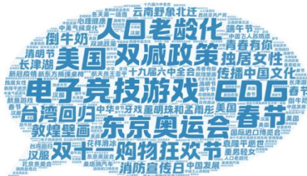
图2 2021年秋季学期“用西语分享中国实事”作业主题词云