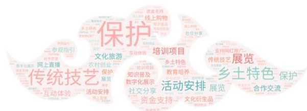
图 3 主要词符展示

短句划分为词，即将连续的字序列按照一定的规范重新组合成词序列的过程。接着，通过高频率词组进行统计和词云展示，就可以提炼出主要信息，反映群众留言中大家的主要倾向。词云绘制结果如图 3。