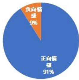
图 2 情感分析

据上图得出：文本数据中正向语言较多，用户对于乡村非遗宣传模式满意度较高，提出的大多为积极性建议。