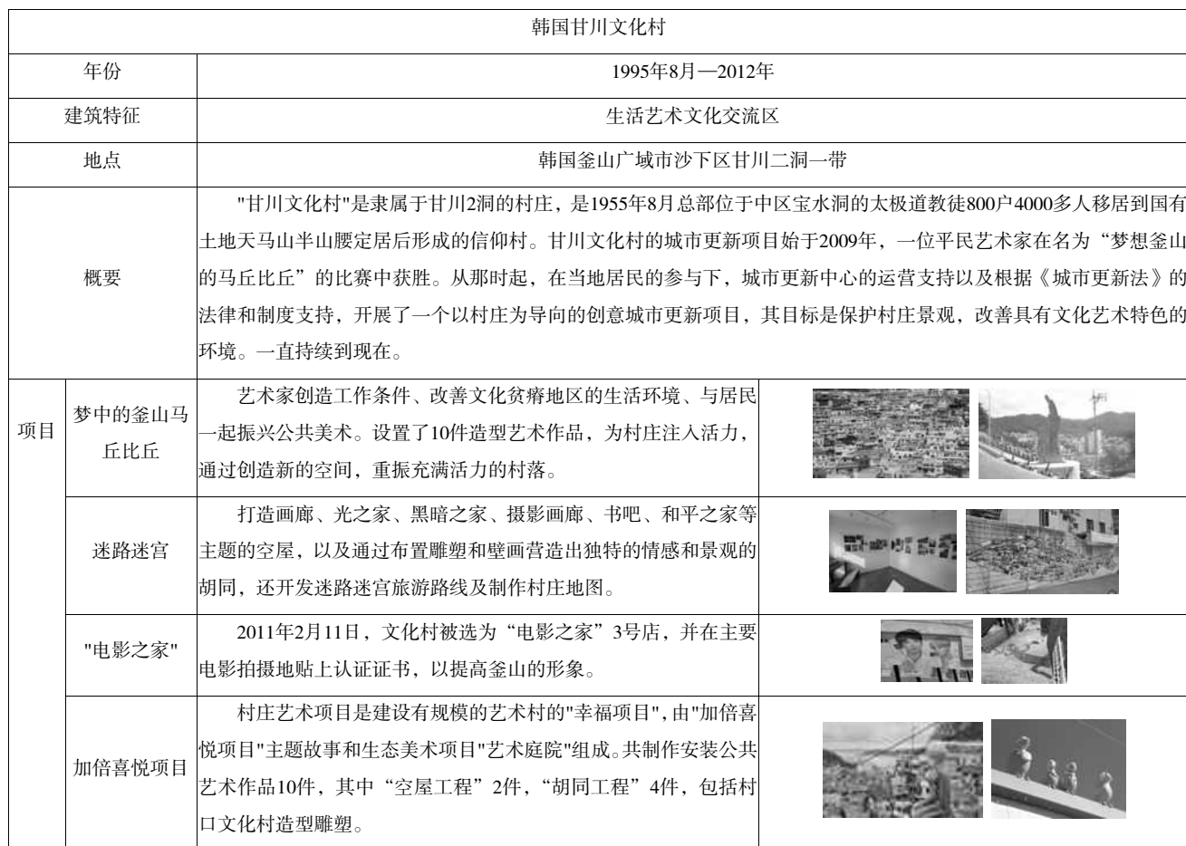
表1 韩国甘川文化村

本研究将选取韩国代表性的艺术村落-甘川文化村为分析对象。案例选择具体标准是,以一定的经济产业为基础,过去成为城市中心型产业,现在虽然是落后的产业设施,但是具有当地社区文化要素、具有可再生价值的经济条件或物理基础、具有潜在恢复力的地区。通过设计的可访问性,实现了目前物理价值的最大化,在当地社区生活中形成文化和艺术交流中心的案例。通过研究地点的开发方式和政府提出的提议、与相关企业的合作以及居民的参与,选定了以居民为主要服务对象的案例。服务集团的大部分不是专家或者特殊阶层,而是普通大众,具有大众性,改善地区的基础设施,提供便利的娱乐活动和艺术、文化交流平台等大众性的案例。